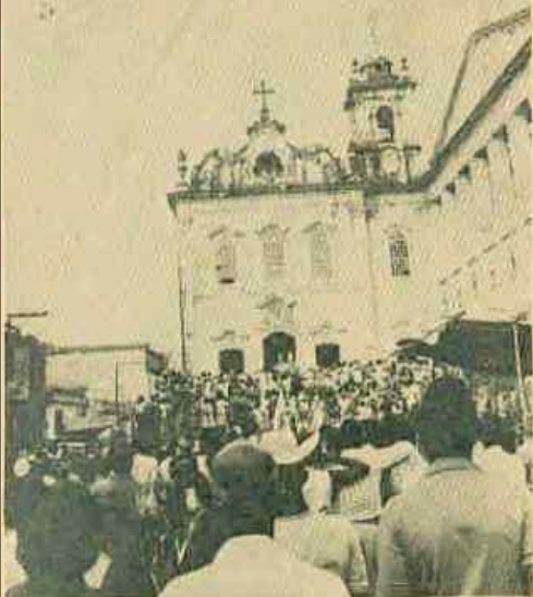
O ponto alto dos festejos será no dia 13, quando a Procissão de Santa Luzia estará percorrendo as principais ruas da parte comercial de Salvador.

UMA boa "pedida" para este início de semana em Salvador é a tradicional festa de Santa Luzia, que será realizada a partir de