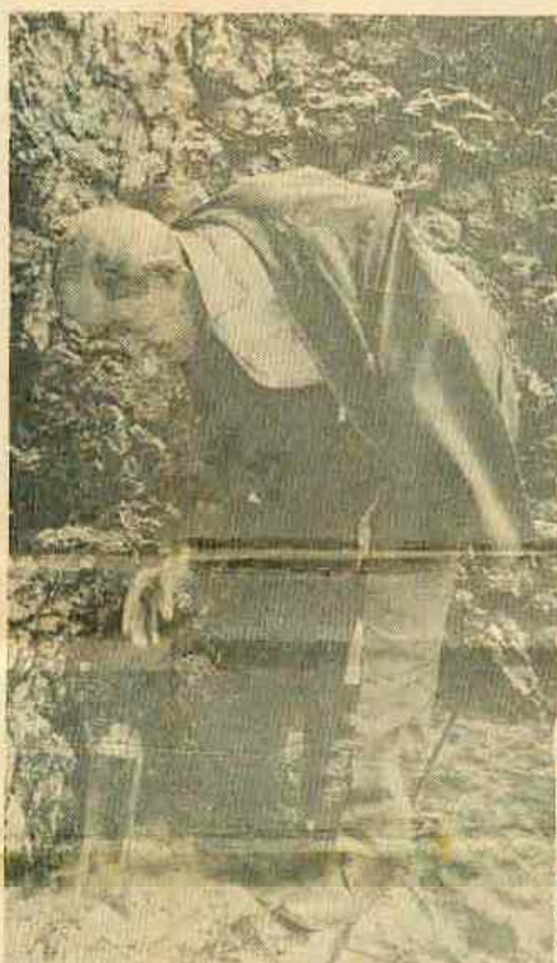
A fonte milagrosa, que na opinião de fiéis é a responsável pela cura de várias moléstias do globo ocular.